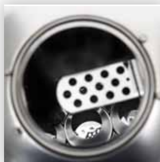
Raccogli cenere e dispositivo di scarico.