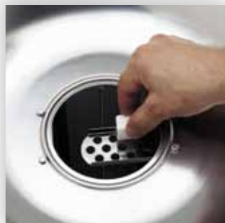
Dispositivo d'accensione brevettato.