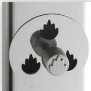
Presca d'aria per la regolazione agevole della brace.